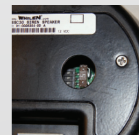
Enchufe de goma resistente al agua que se ilustra para ver el modo de interruptores y el fusible