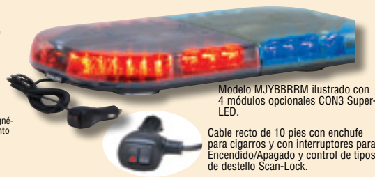
Modelo MJYBRRM ilustrado con 4 módulos opcionales CON3 Super-LED.