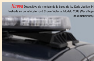
Nueva Dispositivo de montaje de la barra de luz Serie Justice 44 ilustrada en un vehiculo Ford Crown Victoria, Modelo 2008 (Ver dibujo de dimensiones)