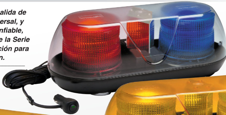
G7MCRB Montaje Magnético

Su estilo liso y brillante, salida de luz superior, montaje universal, y operación silenciosa y confiable, hacen de los productos de la Serie Guardian su primera elección para protección de señalización.