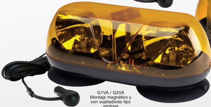
G1VA / G2VA Montaje magnético y con sujetadores tipo ventosa