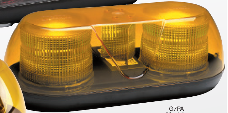
G7PA Montaje Permanente

La Serie Guardian viene con tipos de montaje permanente, magnético, magnético / con sujetadores tipo ventosa.