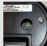
Enchufe de goma resistente al agua que se ilustra para ver el modo de interruptores y el fusible