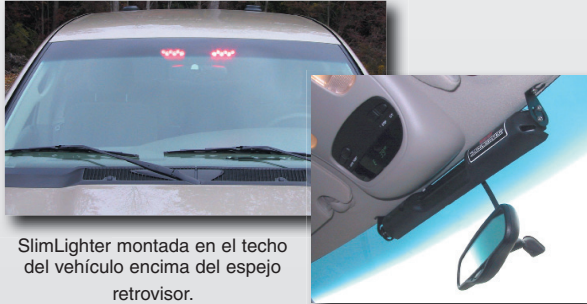
SlimLighter montada en el techo del vehículo encima del espejo retrovisor.