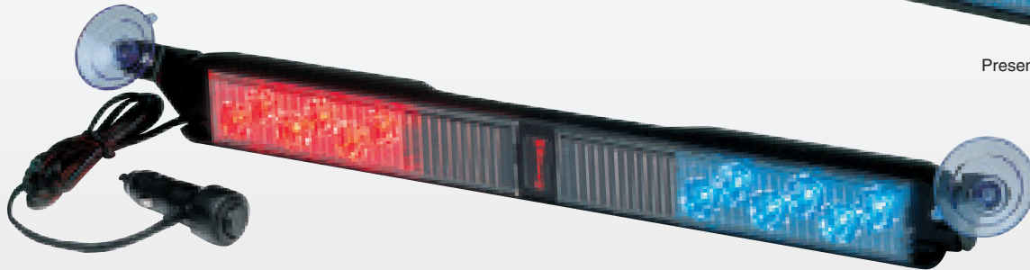
Alumbrador delgado en espesor Super-LED