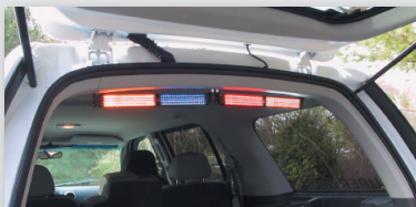
SlimLighter doble montado en el techo en la parte trasera del techo del vehículo.