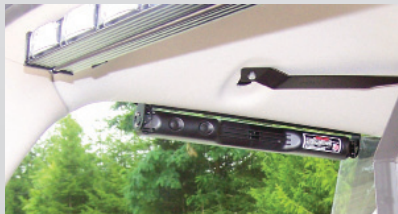
SlimLighter montada dentro de la ventana lateral del vehículo.