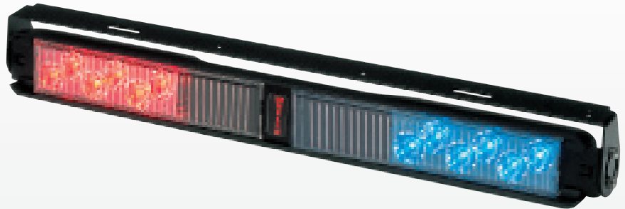
Presentación con soporte de manija opcional

Iluminación Súper-LED® para tablero de instrumentos, con luz ultra intensiva que viene en una caja delgada en espesor que encaja perfectamente en muchos sitios de su vehículo.